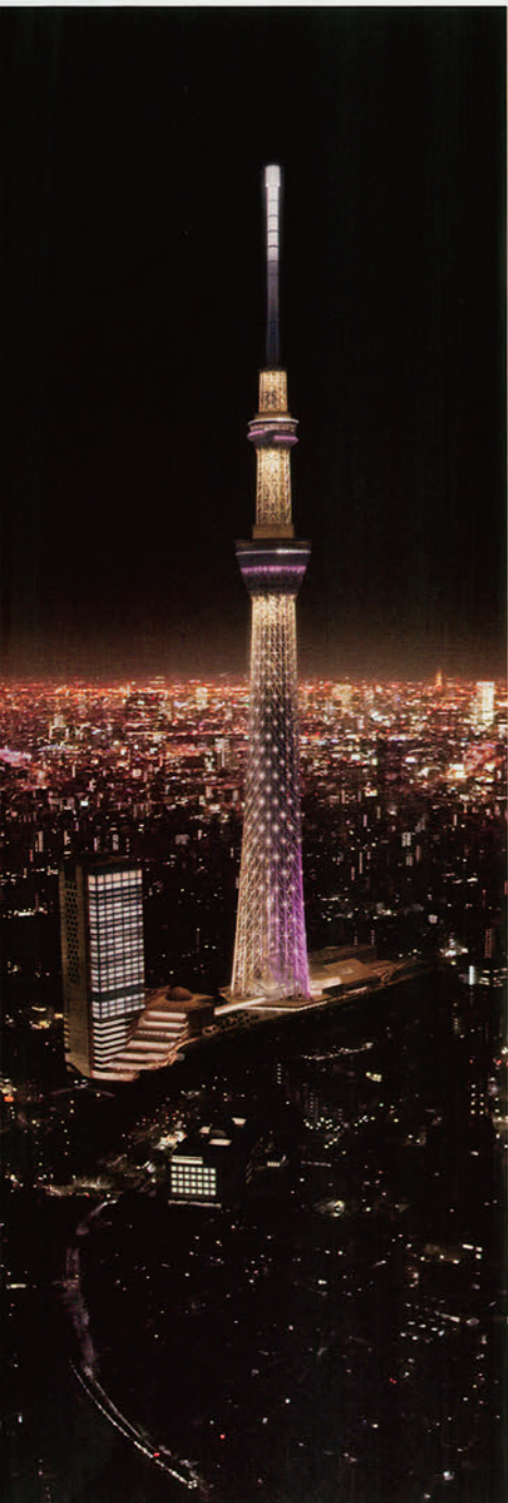
東京スカイツリーのライティングイメージ (雅)

このプロジェクトが東京、関東、そして日本の活性化に少しでもお役立ちできるよう、開業に向けて万難を排し、全力で臨んでまいりたいと考えております。是非皆様も、東京にお越しの際には「東京スカイツリータウン」へ足をお運びくださいますよう、お待ちしております。