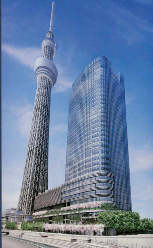
東京スカイツリーと東京スカイツリー イーストタワー