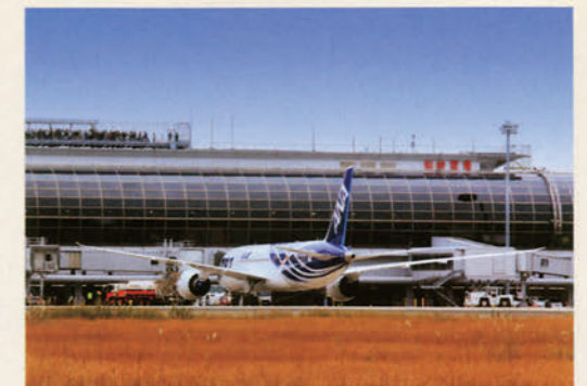
表紙写真/平成23年10月30日(日)「仙台空港復興応援フライト」で仙台空港を離陸するANAの最新鋭機ボーイング787