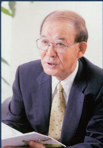
東武鉄道株式会社 専務取締役